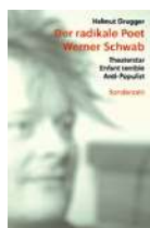
Helmut Grugger Der radikale Poet Werner Schwab. Theaterstar, Enfant terrible, Anti-Populist Sonderzahl, 280 S.

Eine herkömmliche Biografie würde dem »Shootingstar der Theaterszene« nicht gerecht, meint der Verlag. Wer also tieferschürfend zu Werner Schwab lesen möchte, lernt bei Grugger in einem sorgfältig konstruierten, übersichtlichen Band. ■